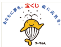
このマークは宝くじ助成事業で助成をいただいた備品についています。

■ ブランコ、小型プロジェクター、延長コード、ノートパソコン、スクリーン三脚立て、収納バック