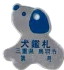
<登録の時にお渡しする犬鑑札は迷子札になります>