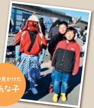
まちで見かけた元気な子