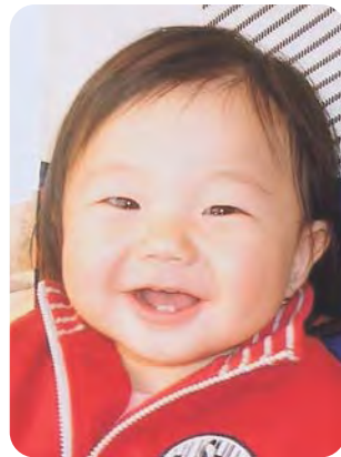
夏穂の笑顔😊に家族みんながニッコリ♡