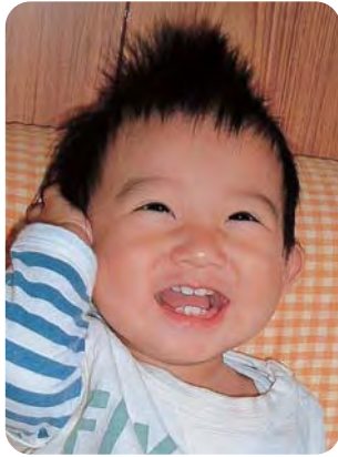
がんこでなかなか困らせてくれます😊