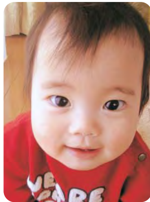
兄ちゃん大好き！いっぱい遊んでね😊