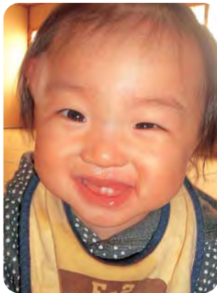
歌がかかるとおしりをフリフリしておどります♪