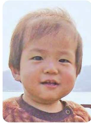
兄ちゃんにしごかれたり、助けられたりしています。