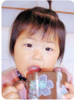
お姉ちゃん、お兄ちゃんこれからもいっぱい遊んでね。