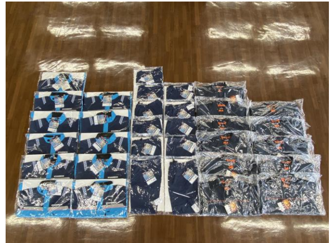
＜ホワイトシャッターを試験導入した余市町の消防車両＞ ＜余市町への提供資機材例：感染防止衣＞