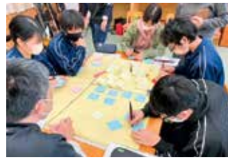
まちトークの様子

例えば、取り組みに必要な消耗品や備品、講師の謝金、初年度の食材費や光熱水費などが対象です。詳細については、まちトーク実施に向けた打ち合わせなどで市・社協職員から説明させていただきます。