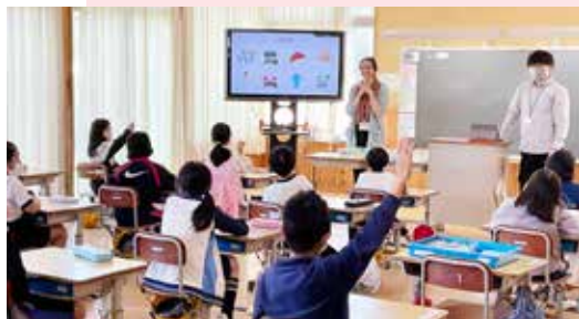
フランス語のクイズゲームをする様子

このように直接子どもたちと触れ合いながらフランスの文化を伝え、交流することができ、有意義な時間となりました。