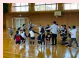
漁師と魚取りゲームをする様子