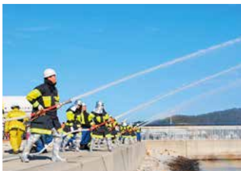
出初め式祝賀放水