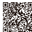
講演会申し込みフォーム