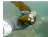
御宿 The Earth の巻