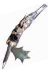
魔除けのイワシ・アラクサ

定期休館日 12月26日(火)～30日(土)は定期休館日です。12月31日(日)から開館します。