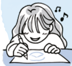
イラスト/デザイン 大西 絵里奈

取り組みを知ることでの多くの「自然を守りたい」という想いに触れました。SDGsとは決して特別なものではなく、目の前の身近なものを大切にする事の積み重ねだと気づかれました。