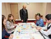
鳥羽シーサイドホテルの巻