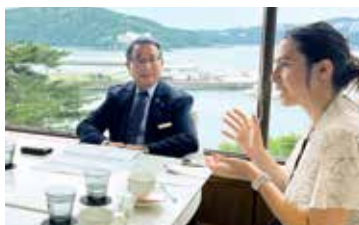
宿泊施設にて取材の様子

*サステナブルツーリズム…持続可能な観光。現在と未来の環境を守りながら「環境」「文化」「経済」の観点で、持続可能かつ発展性のある観光を目指した人々の暮らしを良くしていくこと