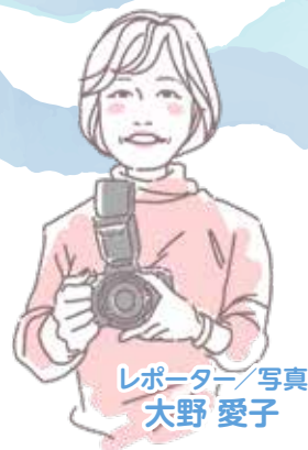
レポーター/写真 大野 愛子