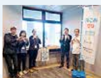
浜の雅亭 一井の巻