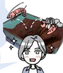
栄養満点の生ごみ堆肥