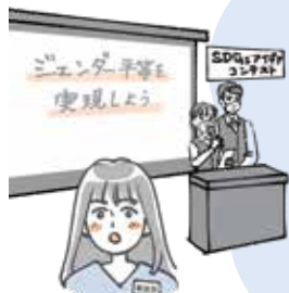
アイデアコンテストを開催