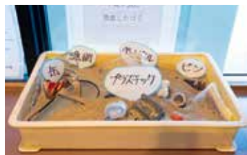
宿泊施設のロビー付近に海ごみを展示