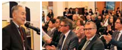
大使公邸での私の講演の様子

メインの任務はレセプションで、初日は在仏日本大使館の大使公邸でのレセプション、2日目は写真家森田恭通氏の神宮を撮った写真展でのPRでした。昼間は政府系機関の日本政府観光局、日本貿易振興機構、自治体国際化協会や、なじみの深い民間企業のJAL、ミキモトの各パリ支店などを訪問し、観光協会の別動チームも旅行会社20数社へセールスをかけました。