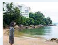
鳥羽国際ホテル 潮路亭の巻