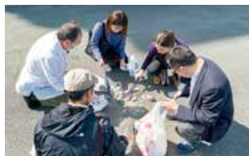
職員のかたと海ごみを分別する様子