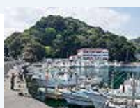
くつろぎの宿 美さきの巻