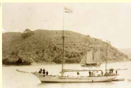
鳥羽港に回航された静岡県水産試験場船 富士丸