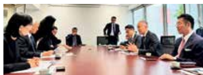
日本貿易振興機構でのPRの様子

そのフランス人が認め、「いいね👍」と評価すると、他の国々がそれに倣うと言われている。鳥羽の魅力の世界へ！世界に向けて鳥羽をアピールしていきます！