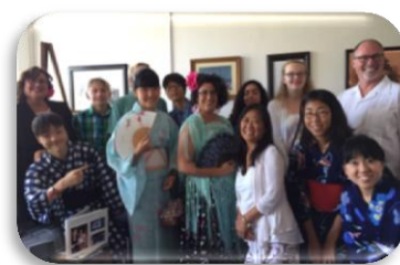
サンタバーバラ市長表敬訪問

サンタバーバラ市中学生派遣・招致事業は、今回で25回目を迎えました。本年は、7月29日(金)から8月9日(火)まで鳥羽市の中学生をサンタバーバラ市に派遣し、8月11日(木)から8月20日(土)までの間、サンタバーバラ市の学生を鳥羽市へお迎えし、それぞれのご家庭でホームステイしていただきました。