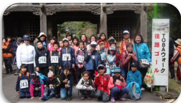
KOKUSAI KIDS CLUB

登りは山道で大変なところもありましたが、美しい景色や会話を楽しみながら、交流を深めることができました。