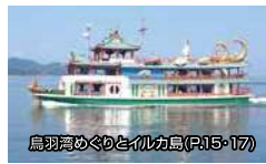
鳥羽海めぐりと伊方島(P.15-17)