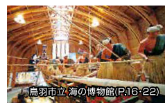
鳥羽市立 海の博物館(P.16-22)