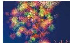
鳥羽みなとまつり(P.10)