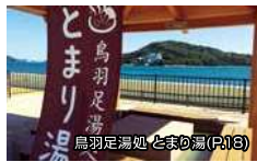
鳥羽足湯 鳥羽足湯処 とまり瀬(P.18)