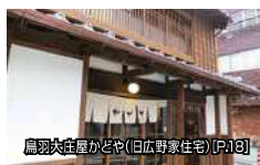
鳥羽大庄屋かどや(日丘野家住宅)(P.13)