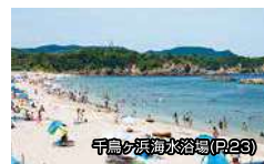
千鳥ヶ浜海水浴場(P.23)