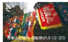
曹達山正福寺・御船祭(P.9-12-20)