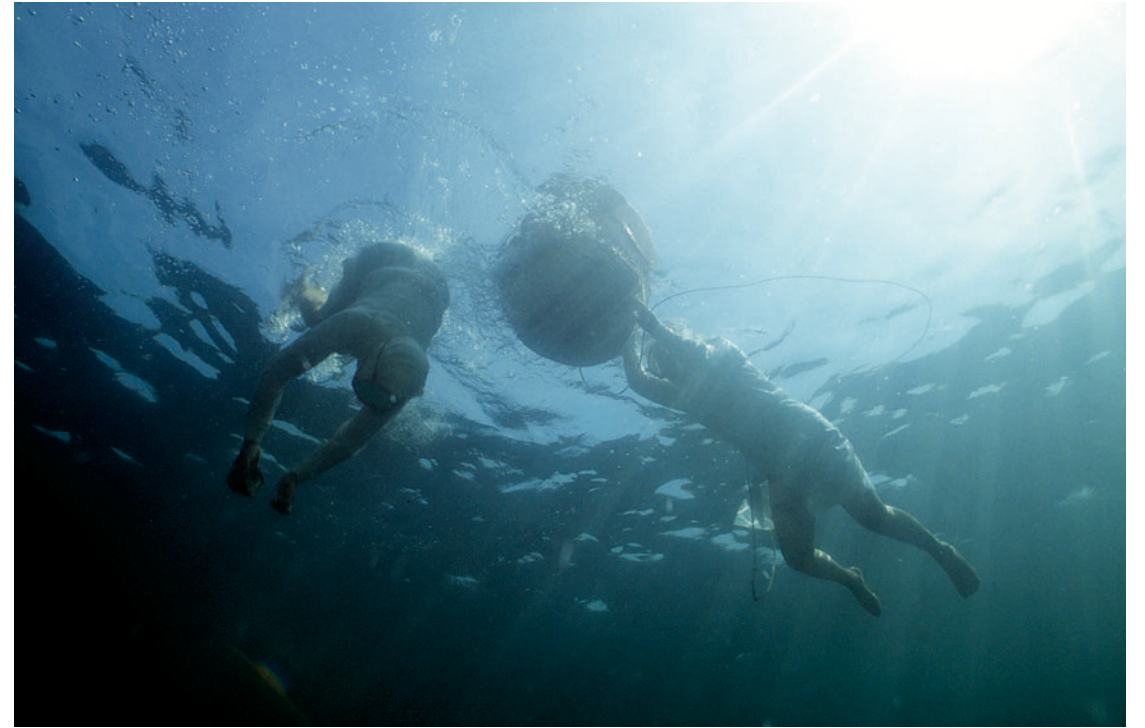
磯桶から潜水開始。

海女は“50秒の勝負”といわれるように、短い潜水時間のうちで、いかに多くの獲物をとるかにかかっています。そのために独特の潜水技術を身につけています。“磯笛”は海面に浮上してする呼吸法です。きびしい潜水作業のため、漁期間が終わると10キロも痩せるといいます。