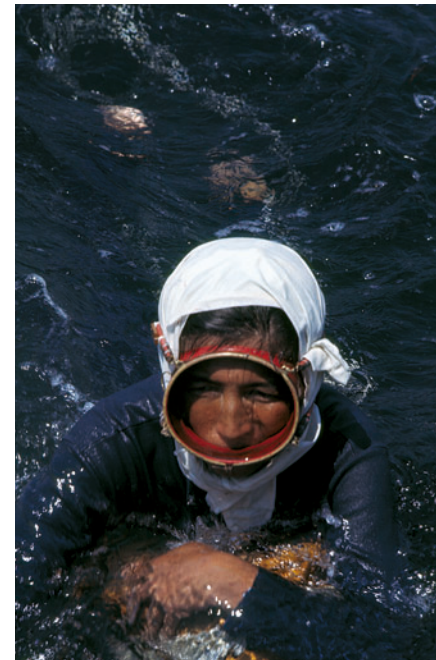
磯笛で呼吸をととのえる。