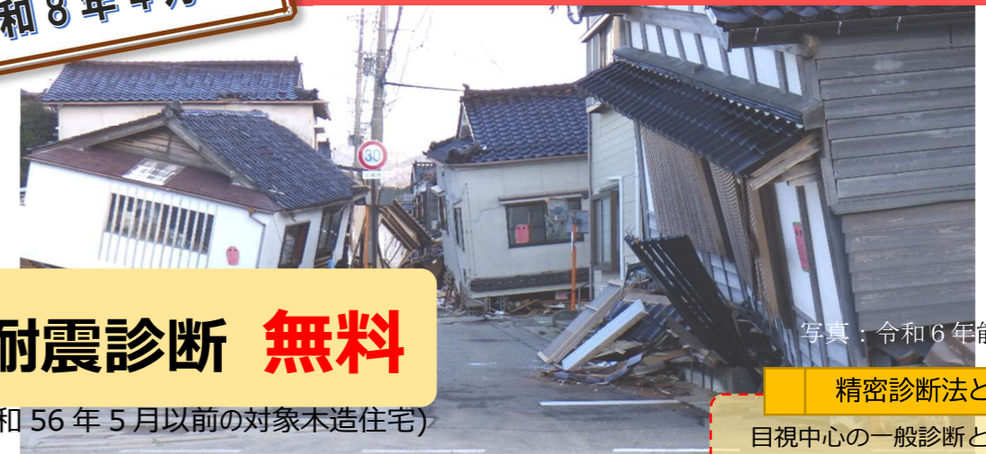
写真: 令和6年能登半島地震