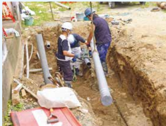
耐震管布設工事の様子