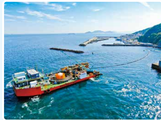
答志島神島間海底送水管布設工事