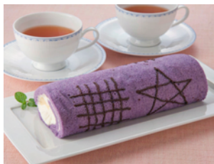
〈海女の真珠 塩ロールケーキ〉 1800円 (税込)

しぐれ煮のように固くせず、やわらかさを残すことで、安楽島牡蠣と茎わかめのうま味を出した逸品