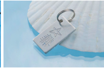
〈セーマン・ドーマン キーホルダー〉 648円 (税込)

海女を象り、海をイメージさせるブルーのトンボ玉をアクセントに加えたステンレス製の海女ペンダント