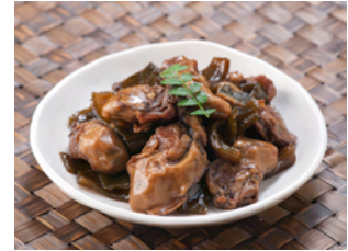
〈安楽島牡蠣と 茎わかめの浜煮〉 750円 (税込)

相差の海女さんが獲った天然の「あらめ」を使用したセミドライタイプの加工品は、お弁当やおにぎり・お茶漬けにピッタリ