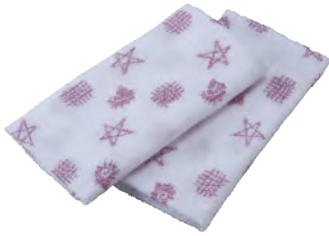
〈セーマン・ドーマン おぼろタオル〉 600円 (税込)

鳥羽市の伝統文化である「海女」を題材とし、日常的に活用できる食品以外のおみやげ4点