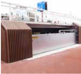
御木本真珠島新防潮扉

しました。①地域住民の避難誘導を最優先とすること。②津波到達予想時刻に、防潮扉等の閉鎖作業は行わないこと。③津波到達予想時刻には必ず安全な高台へ避難を完了していること。この安全管理の徹底を指示しています。