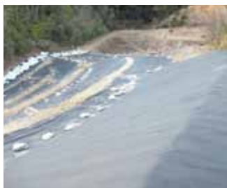
鳥羽市清掃センター最終処分場