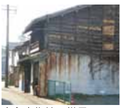
中心市街地の様子

市長 鳥羽に訪れる人が一割でも旧町に回遊すれば活性化が図られると考えます。現在の点と点に存在する施設を線で結び来客者の満足度を高める必要があります、その為には重点的に場所を縮める事です。そして住民自らが愛着をもち、アクションを起こす事が重要で、それを行政がサポートするこ