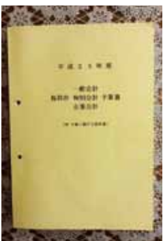
平成23年度鳥羽市予算書

市長 できるだけ町内には足を運んでいますが、役所内の出先機関に出る機会を増やしていきたい。