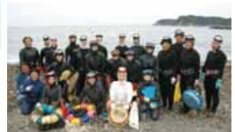
海女サミットの交流のひとつ