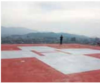
伊勢赤十字病院ヘリポート

その他、子育て支援について①妊婦健康診査②子宮頸がんワクチン接種③ヒブワクチン、小児肺炎球菌ワクチン接種、本市の選挙における投票方法について質問しました。