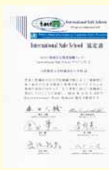
インターナショナルセーフスクールの認証

視察先 大阪教育大学付属池田小学校(インターナショナルセーフスクールの認証について)、兵庫県三田市議会(ホームページ「子育てするならゼッタイ三田」のポイント5なつとく教育環境について)