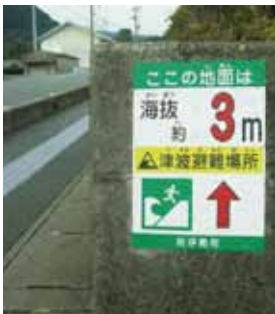
避難場所も一目で分かる「海拔シール」（南伊勢町）

市長 万一に（想定されるような津波が）来ても、単に「スローガン」ではなく、鳥羽市での「犠牲者ゼロ」になるように、みんな考えて行動していきたい。