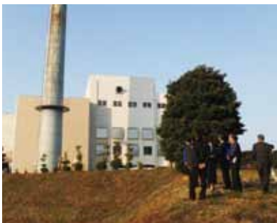
鳥羽市清掃センターを視察

委員会終了後、議案の所管事務調査として、松尾町の鳥羽市清掃センター最終処分場と相差町の弘道小学校体育館を現地視察し、担当者から説明を受けました。