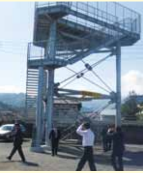
沼津市津波避難タワー

(防災ラジオ及びあしんAEDステーション24設置事業について)、静岡県沼津市(東海地震等における津波対策について)