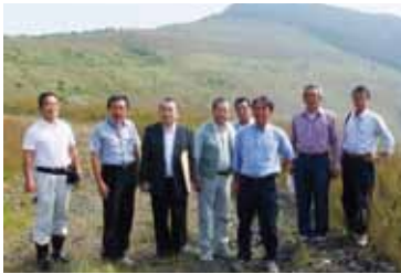
総務民生常任委員会での視察