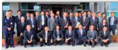
11月12日愛知県田原市議会と交流 このような取組みも議会の仕事です

* http://googledevjp.blogspot.jp/2014/07/noto.html