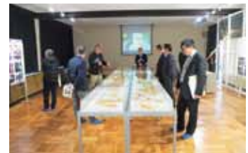
名張市郷土資料館