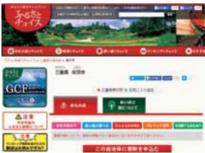
ふるさと納税サイト

答 業務委託として発注しているが、ふるさと納税の受入れに係る入金及び電算処理など市の業務は残っている。