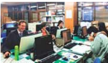
外国人職員が5人いる 北海道ニセコ町商工観光課

問 増加のために①予算と体制②海女文化の発信③アニメポケモンの活用④教育旅行⑤外国人職員採用を提案したい。 答 市長 しっかりと働きかけるよう努力したい。