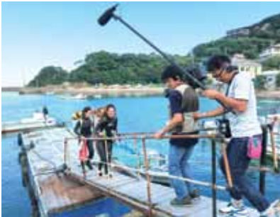
撮影を受ける 地域おこし協力隊の海女見習い

答 市長 このワンストップのことに ついては、本当に効果的でないア イデアだと話を聞かせていただい