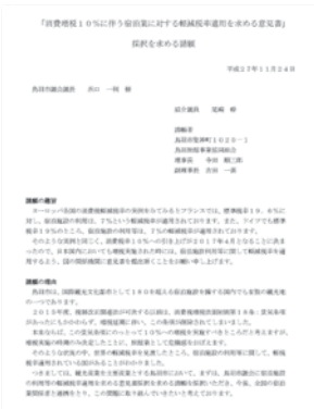
鳥羽旅館事業共同組合からの 請願文

問 本市が持続可能な成長を続けるた めに、基幹産業の観光業の発展は 必要不可欠ですが、今後の観光施 策の方向性は。 答 観光課長 第2次観光基本計画、 10力年計画を掲げ、アクションプ ログラムも策定しています。