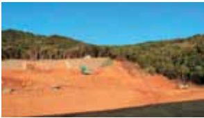
神島小中学校用地造成工事