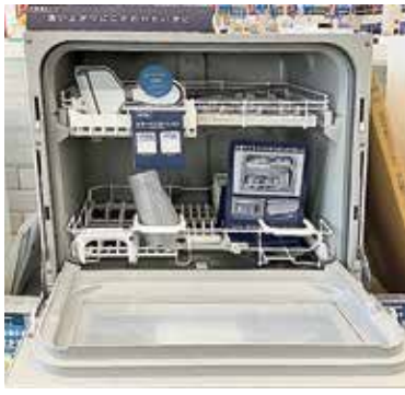
子育て世帯の家事を応援する食器洗浄機