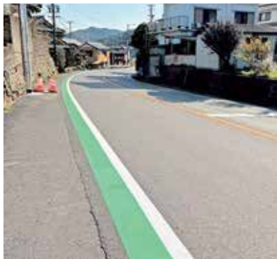
鳥羽中央中学校の通学路に敷設された グリーンベルト

答 教育長 4月から新しく通う中学校がうまくスタートして、子どもたちが新しいステージでしっかりと新たな学びをしていけるように、教育行政に携わる者として一生懸命やっていきたいと思っています。