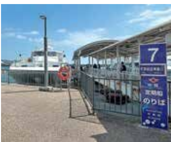
特殊勤務手当の見直しにより、 船員の処遇改善が図られました。