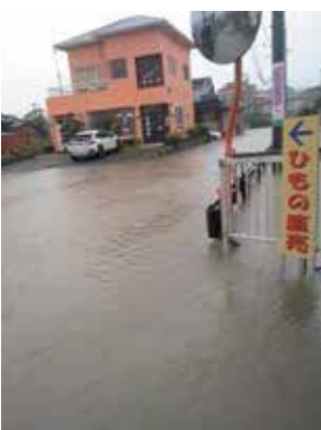
豪雨による池中地区の道路冠水状況

答 副市長 既設の暗渠排水 あんきょ 管の調査の実施に向け今後予算計上を行い、その調査結果を踏まえ町内会と方向性を協議していきたいと考えています。