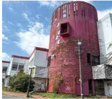
用地取得に向け動き出す「鳥羽パールビル」

● 神島開発総合センター運営経費(施設の経年劣化による軒天コンクリートの剥落に伴い、改修費用を補正) ……387万7000円