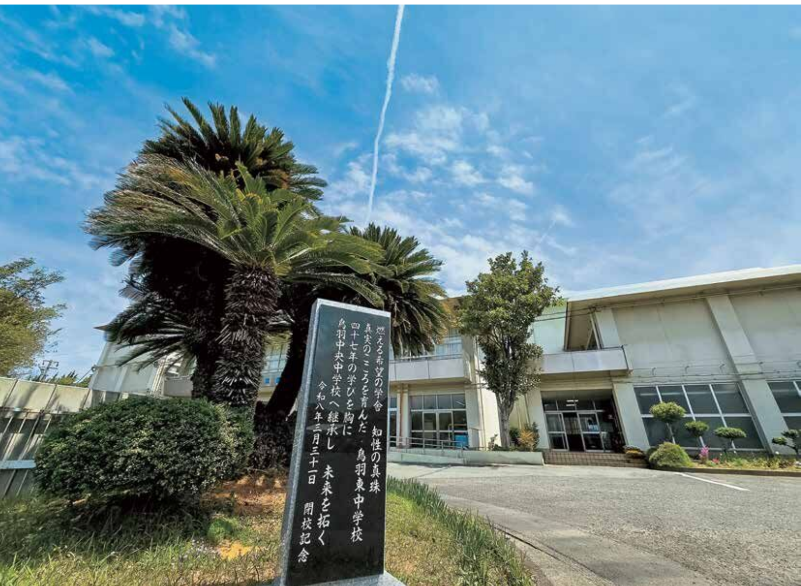
4月14日（火）鳥羽中央中学校の開校式が挙行されました。