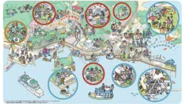
みんなで描いた将来のイメージ(鳥羽駅周辺エリア2040将来ビジョンより)

●本市の将来に関わる重要事業として期待する意見がある一方で、総事業費や市費負担の見通し、不確定要素の多さなどを踏まえると、早期に全体像と財政負担のロードマップを提示し、市民への説明責任を果たすよう求める指摘がありました。