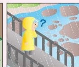
雨が降り続けているのに川の水位が下がる。

急傾斜地等では、大雨の際、土砂崩れが発生するおそれがあります。このハザードマップは、みなさんが住んでいる地区の中で、土砂崩れが発生した場合に被害のおそれがある範囲を示したものです。自分が住んでいる住宅周辺の地形、避難所等をよく確認してください。