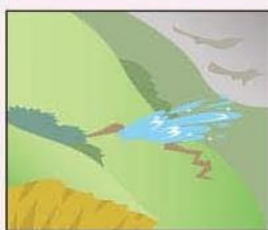
斜面から水がふき出す。地面にひび割れができる。