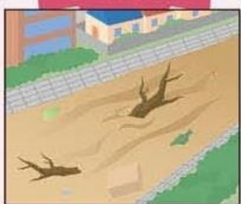
川の流が濁り流木が混ざりはじめる。

長雨や大雨、または地震が発生したときに下記のような現象がおきたら、土砂災害の前兆が考えられます。