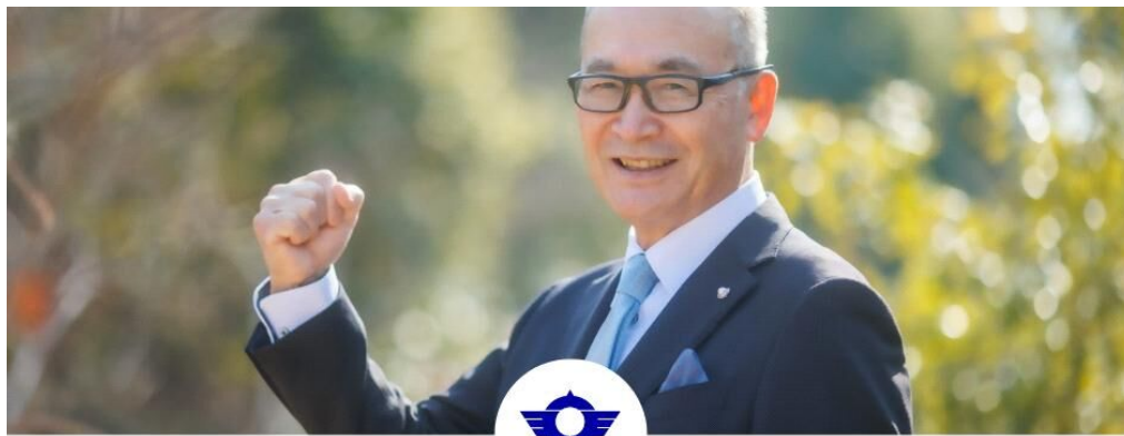
BIGBOSS／小竹あつし（鳥羽市長）

変革のスイッチを入れろ。 ワクワクが止まらない変化をあなたへ モチベーションが上がる環境をみんなへ