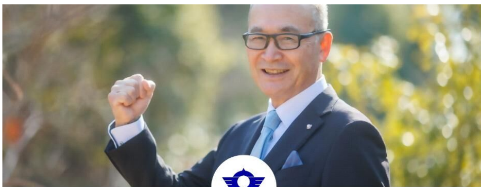
BIGBOSS／小竹あつし（鳥羽市長）

変革のスイッチを入れろ。 ワクワクが止まらない変化をあなたへ モチベーションが上がる環境をみんなへ