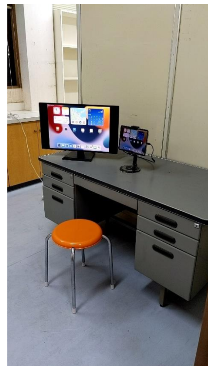
オンライン診療室の服薬指導室