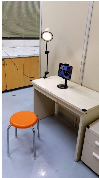
オンライン診療室の診察室