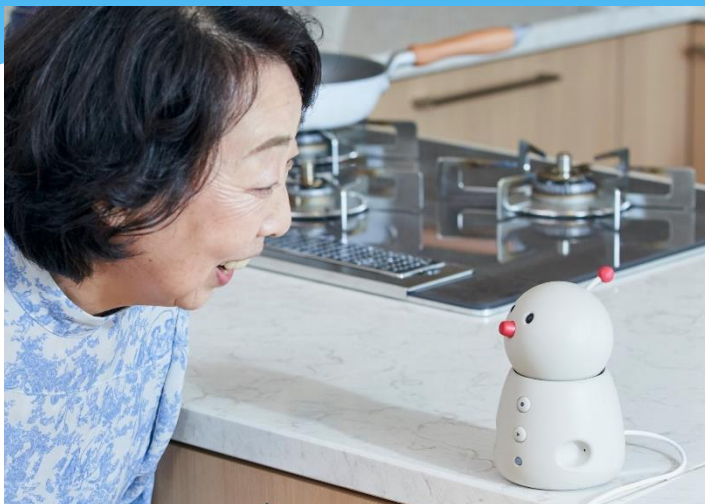
コミュニケーションロボット