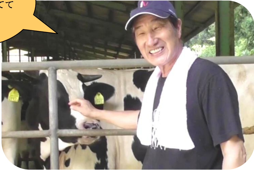
きだほくじょう 木田牧場