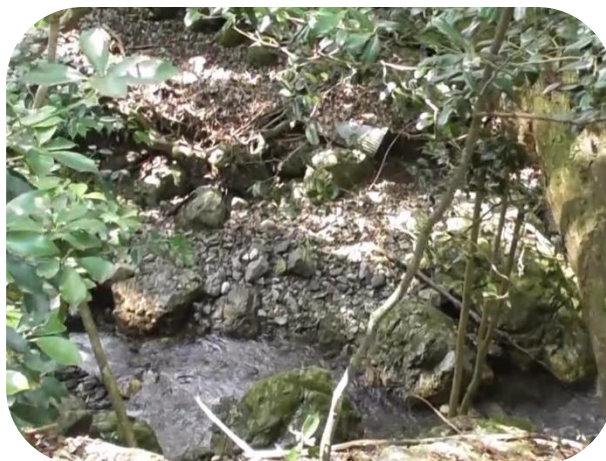
かわ みず の きれいな川の水を飲んでます。