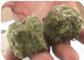
ぼくそう かた 牧草を固めたもの