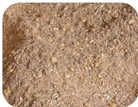
ほい トウモロコシの入ったエサ