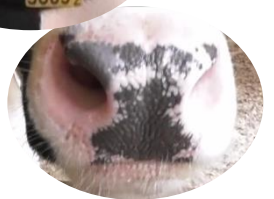
みみ はな びもん 耳のタグや鼻の鼻紋で じょうほう かんり 情報を管理します。