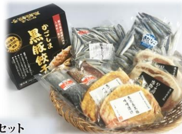
薩摩川内市特産品セット