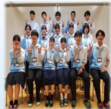
兵庫県立姫路商業高等学校 地域創生部