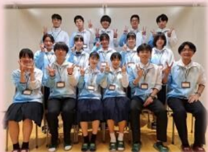
兵庫県立姫路商業高等学校 地域創生部