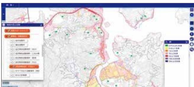
例：津波ハザードマップの津波浸水想定区域（想定最大規模） +津波避難場所（市指定）

各災害における避難所・避難場所のほか、福祉避難所やまちで決めた避難場所などの各種情報を地図上で確認できます。