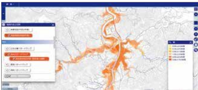
例：洪水ハザードマップの洪水浸水想定区域（想定最大規模）

津波・土砂災害・洪水・高潮などの災害について、今いる場所のハザード情報を地図上で確認できます。