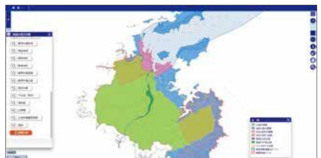
例：鳥羽市景観計画

このほかにも、 航空写真 などを閲覧することができます。また、今後もさまざまな地図データを追加し、みなさんが利用できる地図情報を増やしていく予定です。