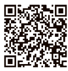
鳥羽駅周辺 エリア2040 将来ビジョン