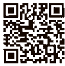
三重県ホームページ