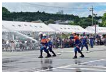
過去の大会の様子