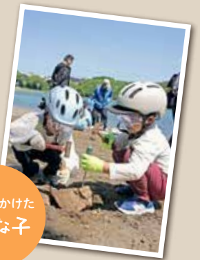
まちで見かけた 元気な子

広報とばに掲載された写真を差し上げます。ご希望のかたは、政策秘書課秘書広報係まで。