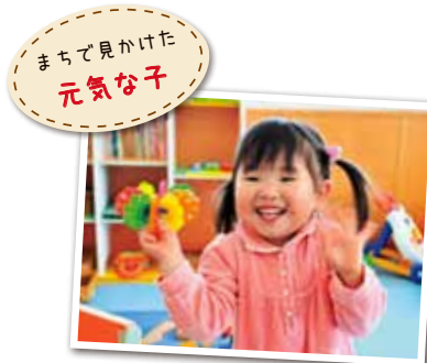
広報とばに掲載された写真を差し上げます。ご希望のかたは、総務課広報情報係まで。