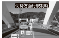
【麻生の浦大橋規制イメージ】