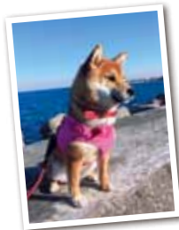
城山春 メス 10か月