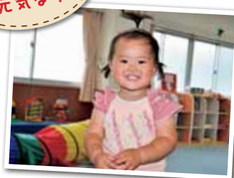
広報とばに掲載された写真を差し上げます。 ご希望のかたは、総務課広報情報係まで。