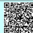
予約手順マニュアル