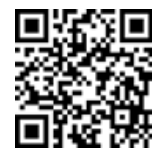
4回目接種券 発行申請フォーム （基礎疾患等）

（送付先）〒517-0022 鳥羽市大明東町2番5号 鳥羽市健康福祉課 新型コロナウイルスワクチン接種対策チーム宛