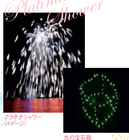
プラチナシャワー(イメージ)

恒例の探してシリーズは「光の宝石箱」を打ち上げます。世界一長い連星花火に驚き、鳥羽でおなじみの5段咲き花火では新作の銀色に輝くプラチナシャワーの美しさに息を呑むような一瞬を醸し出します。