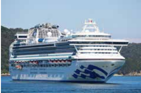
ダイヤモンド・プリンセス