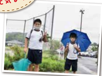
広報とばに掲載された写真を差し上げます。 ご希望のかたは、総務課広報情報係まで。