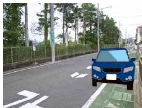
グリーンベルト上に駐停車している自動車

グリーンベルトとは、歩道が整備されていない道路の路側帯に緑色のカラー舗装を行ったものです。ドライバーが車道と路側帯を視覚的に、より明瞭に区分できるようにし、交通事故を防止することを目的としています。