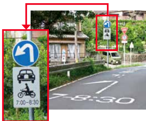
時間帯通行規制が行われている道路と標識