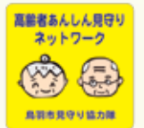
協力店ステッカー

協力店は96店あり、店舗の出入り口などわかりやすい場所にステッカーを貼っています。みなさん、無理のない程度での見守りを行い、やさしく高齢者を支えています。