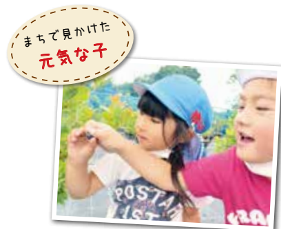
広報とばに掲載された写真を差し上げます。ご希望のかたは、総務課広報情報係まで。