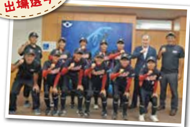
広報とばに掲載された写真を差し上げます。ご希望のかたは、総務課広報情報係まで。