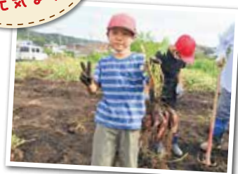
広報とばに掲載された写真を差し上げます。ご希望のかたは、総務課広報情報係まで。