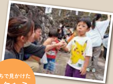
まちで見かけた 元気な子

広報とばに掲載された写真を 差し上げます。ご希望のかたは、 総務課広報情報係まで。