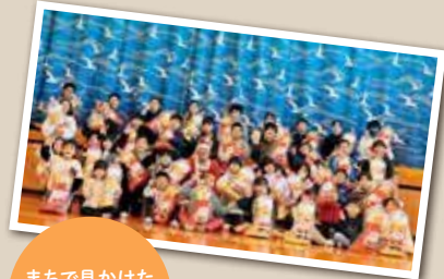
まちで見つけた 元気な子

広報とばに掲載された写真を 差し上げます。ご希望のかたは、 総務課広報情報係まで。