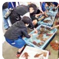
市場にて見学・ 魚と触れ合う様子

お昼は、自分たちでさばいたお魚を食べて、ふるさとの食材への理解を深めていただき、魚食の大切さを学ぶことができました。