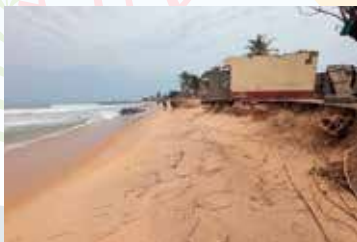
高波で被災して放棄された民家