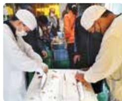
太刀魚をさばく様子