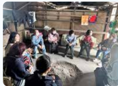
海女小屋でのフィールドワーク

海士潜女神社では、伝説の海女として語り継がれる「おべんさん」の子孫のかたに話を聞くことができたほか、海女さんたちがお米と小豆を海士潜女神社、山の神、海の神にお供える様子を見せてくれ、学生たちは海女たちの信仰心に触れることができました。その後、3か所に点在する海女小屋を見学し、海女たちが実際に使用しているノミやタンポ、スカリやウェットスーツ、おもりを手にとり、使い方や漁について話を聞き、海女文化を肌で感じました。