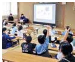
講義を受ける様子