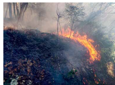
令和6年に鳥羽市内で発生した林野火災