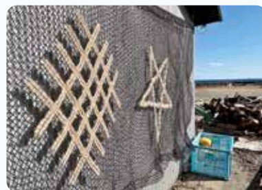
国崎の海女小屋での作品の撮影

このプロジェクトを通じて、国崎町の歴史や習俗、海女文化の魅力を学生たちがアートとしてどのように表現したのか、その成果をぜひご覧ください。