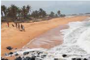
荒れた海で貝を採る人々

その一方で、ガーナの海岸は深刻な「侵食」という問題を抱えています。砂浜が消失し、高波を防ぐ力が弱まったことで、住居や集落の浸水被害が後を絶ちません。特に海岸部の低所得世帯への影響は深刻です。資産を失うと再建に時間がかかるだけでなく、遠地への移転と離散を余儀なくされ、長年培われたコミュニティが分断されてしまうことも大きな課題となっています。