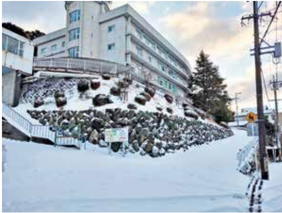
令和5年1月の積雪の様子

降雪・積雪時に気を付けたいポイントや家庭でできる具体的な対策については、市ホームページに掲載しています。ぜひ、事前の備えやいざという時の参考にしてください。