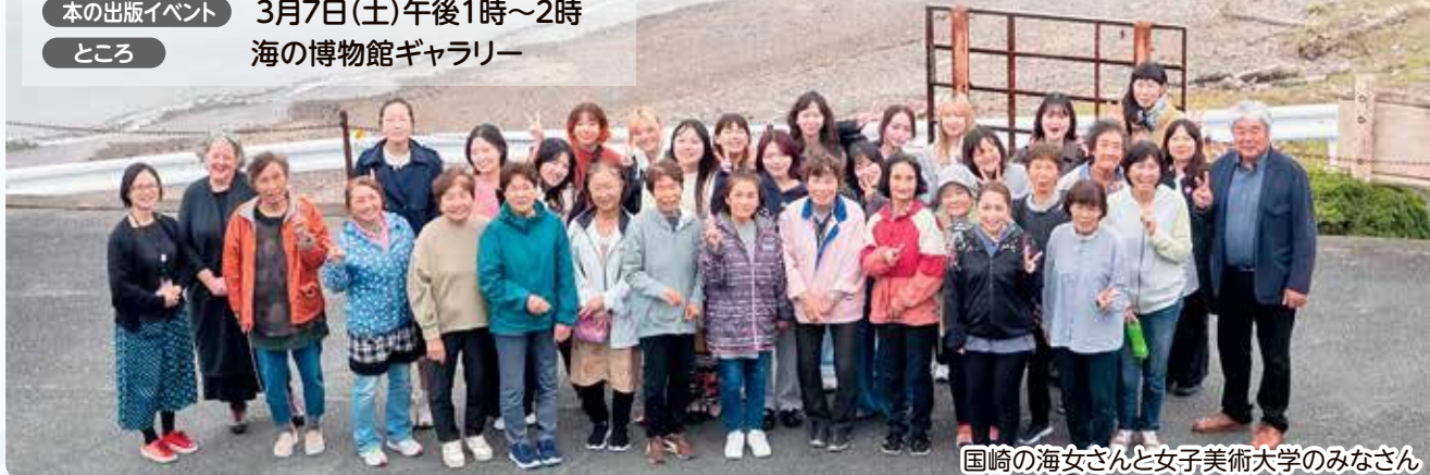
国崎の海女さんと女子美術大学のみなさん