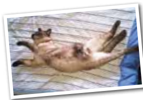
栗原チョコ オス 2歳