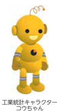
工業統計キャラクター コウちゃん

運航期間 12月28日(土)～平成26年1月4日(土)の8日間 和具行き臨時便 佐田浜午後4時10分発 ↓和具4時25分着 ※臨時便のほかにも、乗客数に応じて、通常運航している定期便を増便することがあります。増便がある場合は、桟橋にて放送しますので、注意していただきますようお願いいたします。