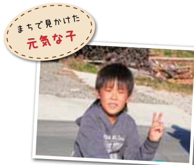
広報とばに掲載された写真を差し上げます。ご希望のかたは、総務課広報情報係まで。