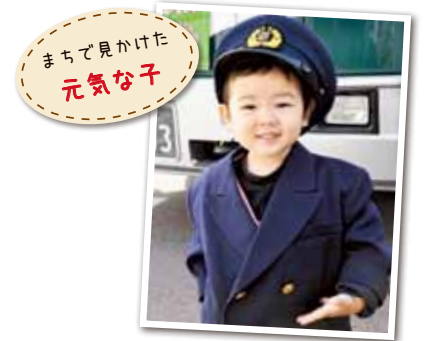
広報とばに掲載された写真を差し上げます。ご希望のかたは、総務課広報情報係まで。

婚姻の届け出を予定しているかたは、12月28日(月)までに市民課戸籍係へ相談してください。また、本人確認のために運転免許証、健康保険証などをお持ちください。(書類に不備があると、提出日に受理できないことがあります)