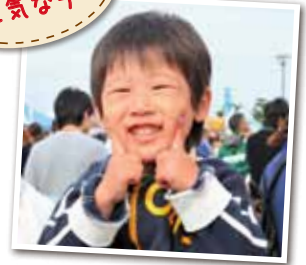
広報とばに掲載された写真を差し上げます。 ご希望のかたは、総務課広報情報係まで。