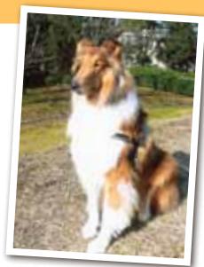
片岡ラウル オス4歳