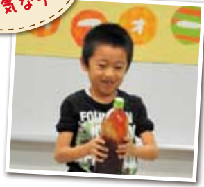
広報とばに掲載された写真を差し上げます。 ご希望のかたは、総務課広報情報係まで。