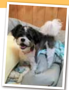
河村虎太郎 1歳 オス 「自由に我が道を行く河村家のラスボスです」