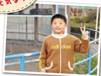
広報とばに掲載された写真を差し上げます。 ご希望のかたは、総務課広報情報係まで。