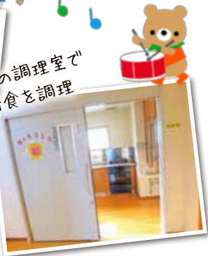
専用の調理室で給食を調理