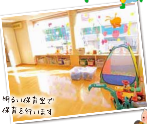
明るい保育室で保育を行います