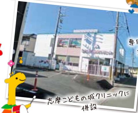
志摩こどもの城クリニックに併設

登録方法 利用は原則として事前登録が必要です。 よいこ病児保育室または医療法人童心会はね小児科医院で登録できます。