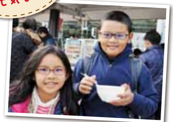
広報とばに掲載された写真を差し上げます。 ご希望のかたは、総務課広報情報係まで。