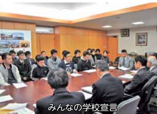
みんなの学校宣言

平成28年12月28日には、答志地区および和具地区の有志で集った答志コミュニティスクール実行委員会のメンバーが市役所を訪問し、市長、教育長に向け、地元答志町内会・和具町内会、鳥羽磯部漁協答志支所・和具浦支所、答志婦人会・和具婦人会からの支援のもと、地域一体となって子どもたちを全国に誇れる人材へと育てあげる「子育ての島」