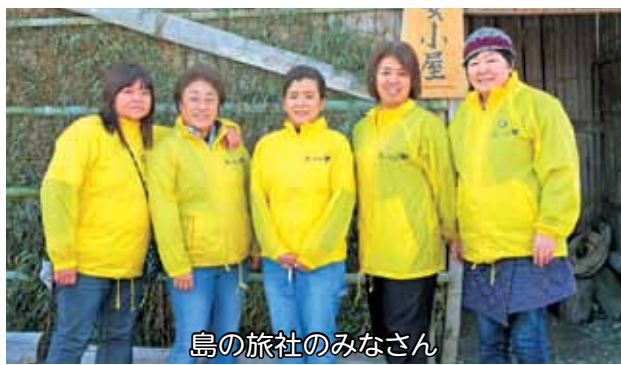
島の旅社のみなさん

気付き、自らのガイドに役立っています。昨年9月と3月には日々の活動である島内案内の経験を活かし、島での暮らしの魅力を体感できる「答志島暮らし体験ツアー」を実施しています。ツアー参加をきっかけに答志島での暮らしの魅力を知っていただき、移住のきっかけになればと語ってくれました。